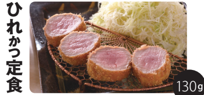
※イメージ画像ですので銘柄ごとに印象は異なります 豚肉の中で最も柔らかく、希少な部位です。脂身はありませんが、濃厚かつジューシーな赤身を味わえます。

★ひれ肉をトコトン極めるお食事はこちらからどうぞ！<ロースかつ定食、上ロースかつ定食、特上ロースかつ定食、上ロースかつ&ミニひれかつ定食はオモテ面をご覧ください>