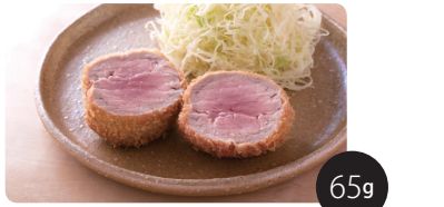
※イメージ画像ですので銘柄ごとに印象は異なります ひれかつを少しだけ楽しみたい方のとんかつです。他の銘柄のロースやひれと組み合わせるのも楽しいです。