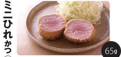
※イメージ画像ですので銘柄ごとに印象は異なります ひれかつを少しだけ楽しみたい方のとんかつです。他の銘柄のロースやひれと組み合わせるのも楽しいです。