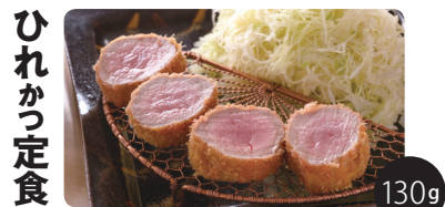
※イメージ画像ですので銘柄ごとに印象は異なります 豚肉の中で最も柔らかく、希少な部位です。脂身はありませんが、濃厚かつジューシーな赤身を味わえます。

★ひれ肉をトコトン極めるお食事はこちらからどうぞ！<ロースかつ定食、上ロースかつ定食、特上ロースかつ定食、上ロースかつ&ミニひれかつ定食はオモテ面をご覧ください>