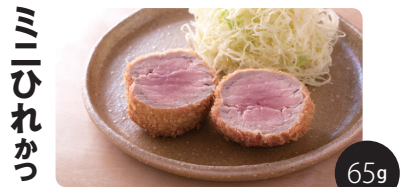
※イメージ画像ですので銘柄ごとに印象は異なります ひれかつを少しだけ楽しみたい方のとんかつです。他の銘柄のロースやひれと組み合わせるのも楽しいです。